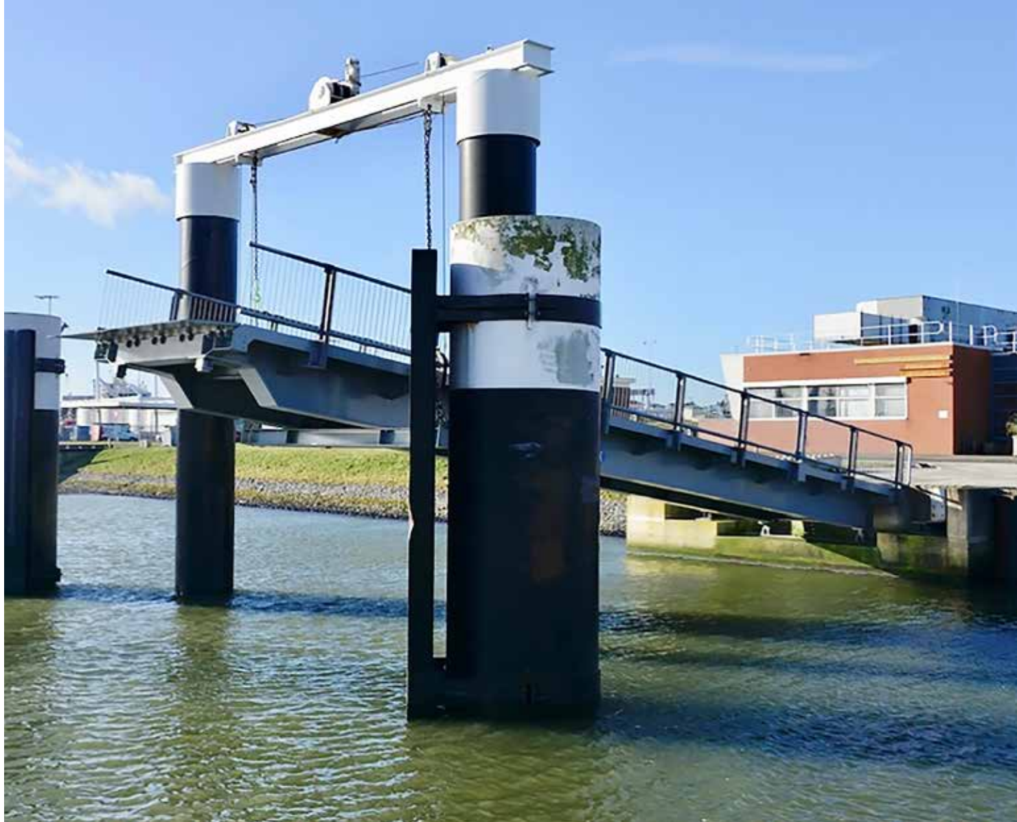
De noodaanlanding in Den Helder op het marineterrein. Rijkswaterstaat wil de installatie de komende periode upgraden.

naar de fuiken. Deze 'drijvende steigers' bij de afmeervoorzieningen begeleiden de TESO-veerboot vanuit zee via bufferschotten richting de wal. De fuiken moeten goed bestand zijn tegen de krachten van het water als de veerboten aanmeren of uitvaren. Daarom is het belangrijk dat ze in goede staat zijn. De Vries: "Onderzoek moet uitwijzen wat de staat is van deze fuiken en of er sprake is van een situatie die de komende jaren standhoudt. Of dat we toch eerder in actie moeten komen voor grotere bedrijfszekerheid."